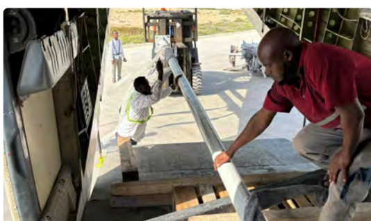
Transport de Poteaux en Acier