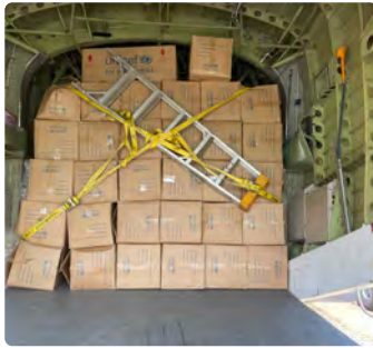
Matériaux de Construction