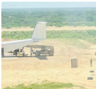
Opérations en Zones Isolées