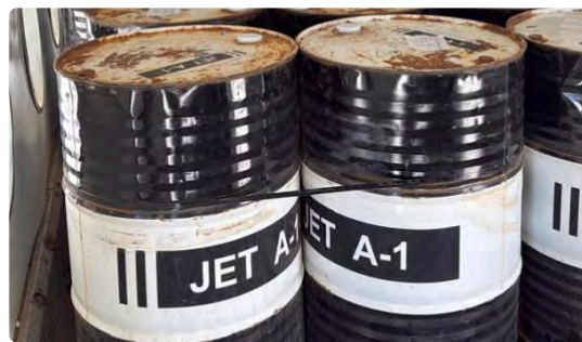
Opération de Transfert de Carburant