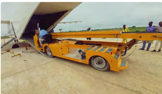
Utilisation des Rampes