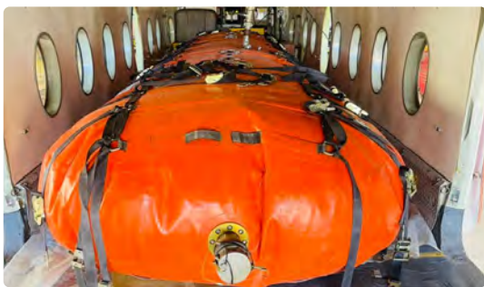
Photo du Réservoir BATT de Carburant