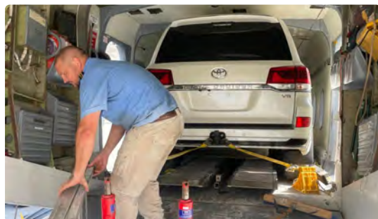
Transport Sécurisé de Véhicules