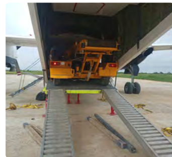
Porte de Chargement Arrière