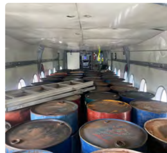
Transport de Marchandises Dangereuses y compris Carburant