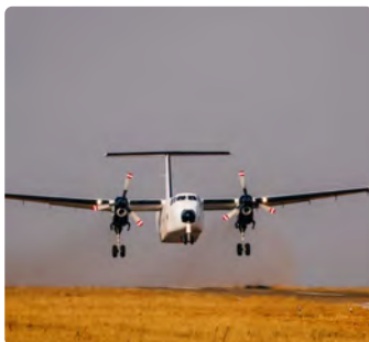
Opérations sur Pistes Courtes