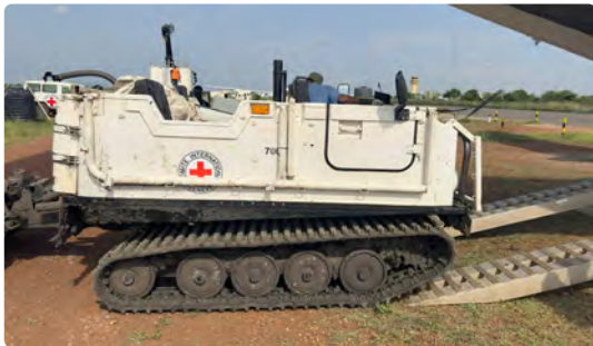
Procédure de Chargement des Véhicules